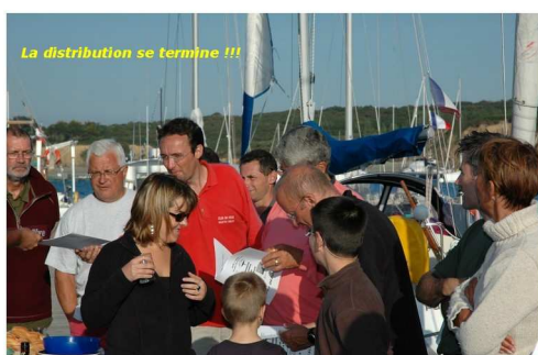
La distribution se termine !!!

C'est avant l'apéritif que nous distribuons les bulletins d'élection du « guidon » de l'association et les programmes du rassemblement. Précaution prudente, puisque les agapes se prolongeront tard dans la nuit.