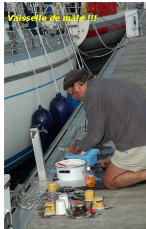
Vaisselle de mâle !!!