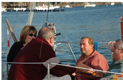
Décidément Ils en ont des choses à se dire !!!