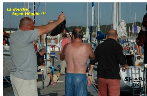
La douche façon Héquin !!!

C'est avant l'apéritif que nous distribuons les bulletins d'élection du « guidon » de l'association et les programmes du rassemblement. Précaution prudente, puisque les agapes se prolongeront tard dans la nuit.