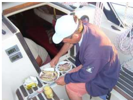
A ces maquereaux à la moutarde !...